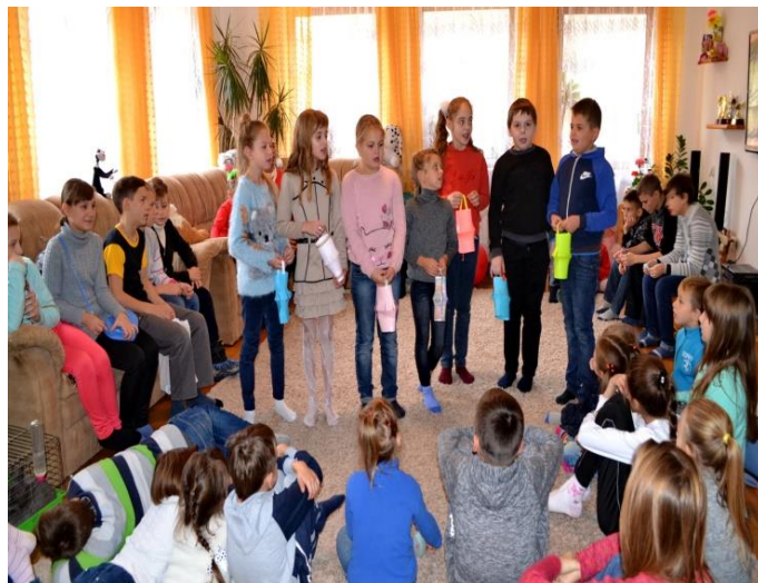
Дитячий будинок сімейного типу «Отрадне» 2017/2018 рік