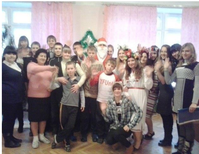
Центр Реабілітації 2014/2015 рік