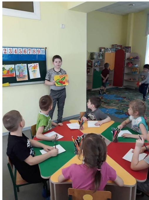
Мастер-клас для учнів НВК №7 2019/2020