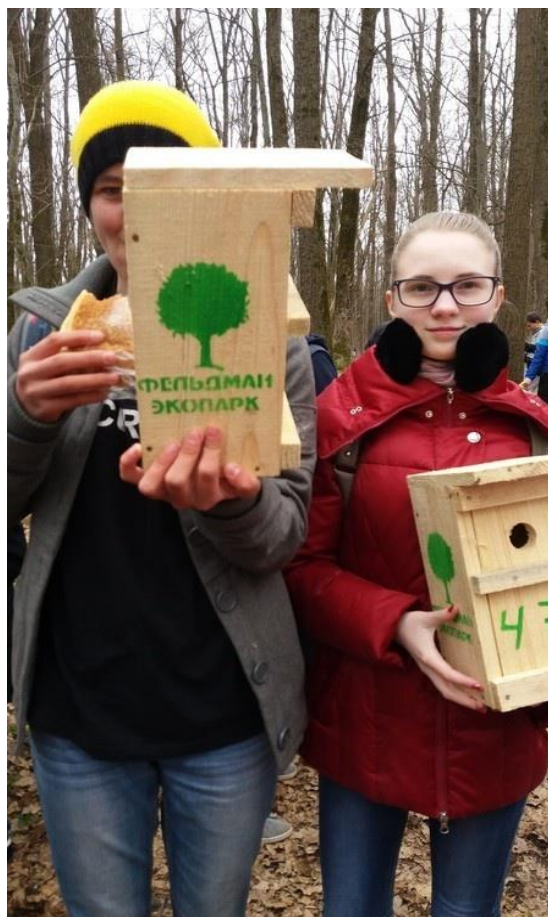
Участь у екологічній акції "Збережемо птахів разом" у Фельдман еко- парк