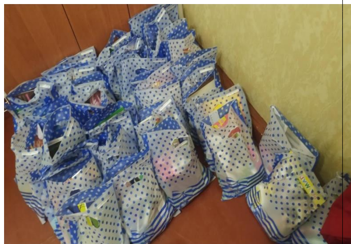
Відвідування реабілітаційного центру 2019/2020