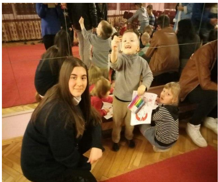
Центр Реабілітації 2017/2018 рік