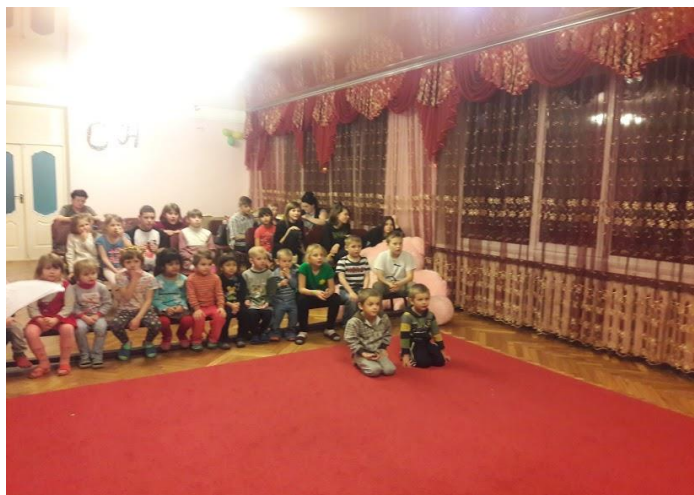
Центр Реабілітації 2016/2017 рік