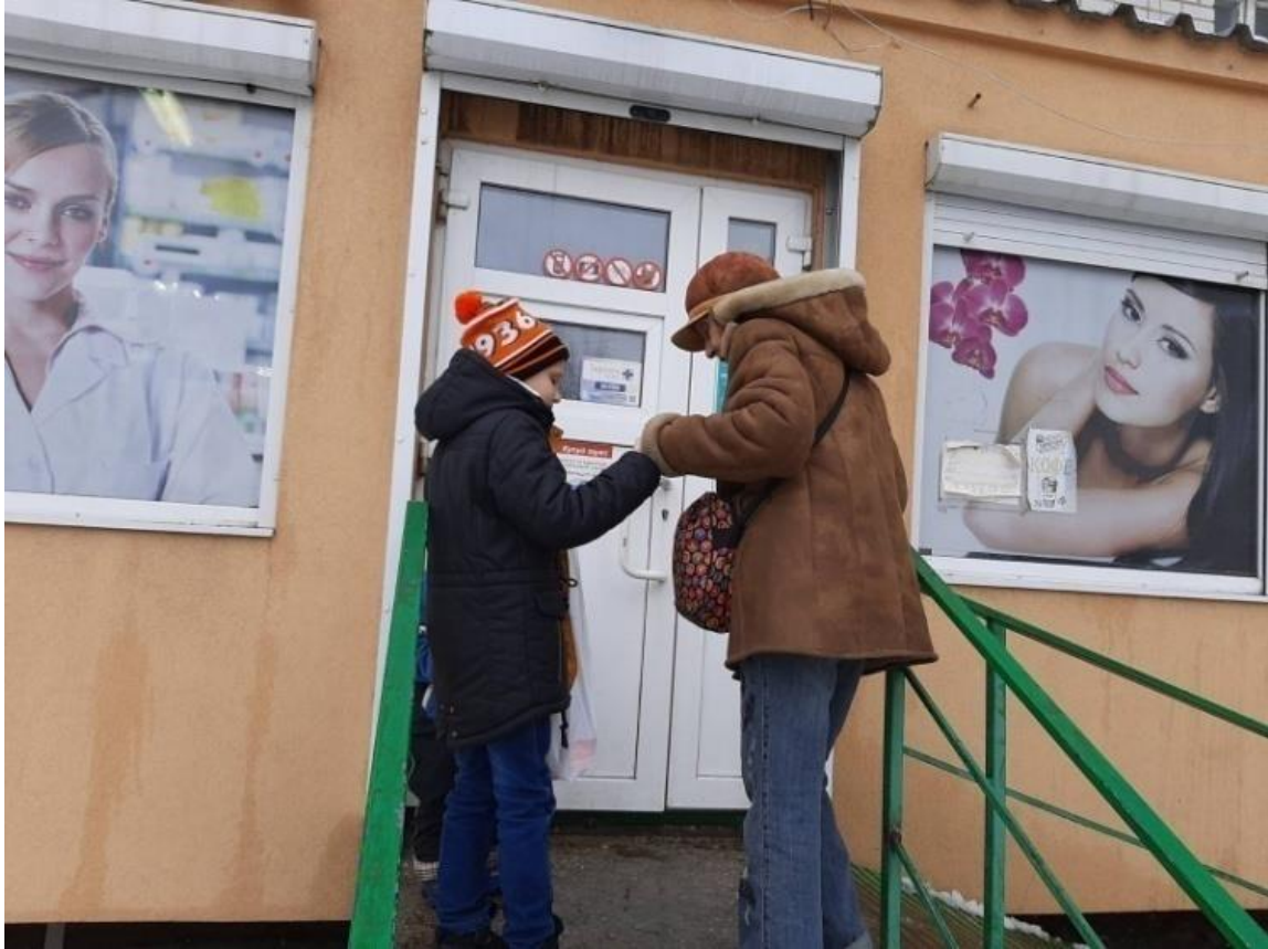
Конкурс малюнків «Допомога людям похилого віку»